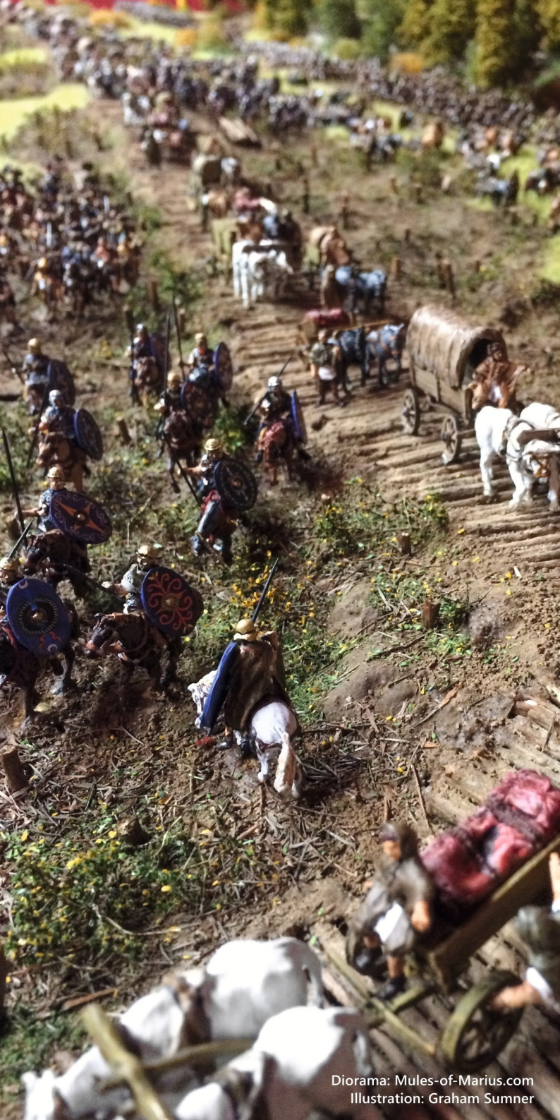
Diorama: Mules-of-Marius.com Illustration: Graham Sumner