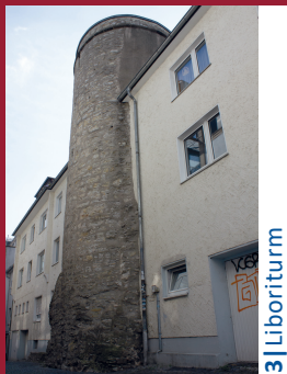
3 | Liboriturm