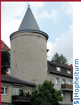
5 | Hopheiturm