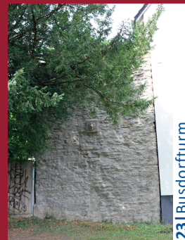
23 | Busdorfurm

Öffentlicher Stadtmauer-Rundgang für Erwachsene und Kinder ab 8 J. Samstags 14 Uhr Dauer: 1,5 Std. (nur Eintritt) Treffpunkt LWL-Museum in der Kaiserpfalz Am Ikenberg 2 · 33098 Paderborn Tel. 05251 1051-10 kaiserpfalzmuseum@lwl.org www.lwl-kaiserpfalz-paderborn.de www.facebook.com/museuminderkaiserpfalz