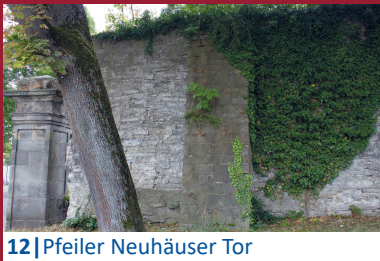
12 | Pfeiler Neuhäuser Tor