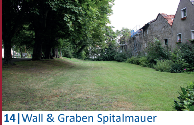
14 | Wall & Graben Spitalmauer