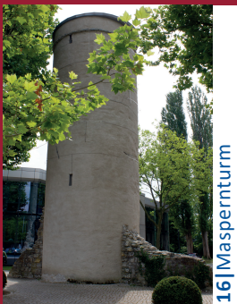
16 | Mäsperturm