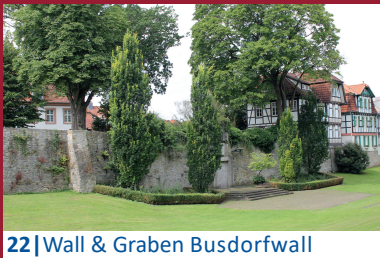
22 | Wall & Graben Busdorfwall