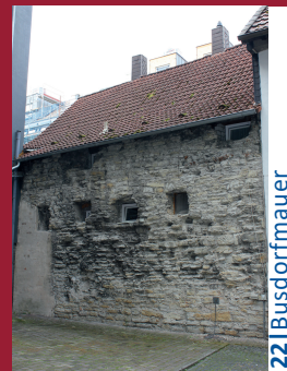
22 | Busdorfmauer