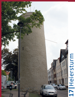
17 | Heiersturm