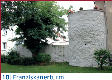
10 | Franziskanerturm