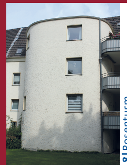
8 | Rosenturm