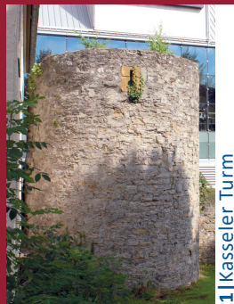
1 | Kasseler Turm