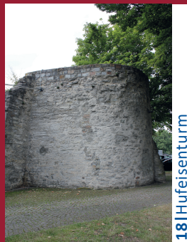
18 | Hufeisenturm